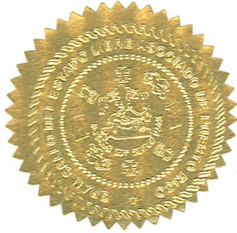
WANDA VÁZQUEZ GARCED GOBERNADORA

EN TESTIMONIO DE LO CUAL, expido la presente Orden Ejecutiva bajo mi firma y hago estampar el gran sello del Gobierno de Puerto Rico, en La Fortaleza, en San Juan, Puerto Rico, hoy 12 de junio de 2020.